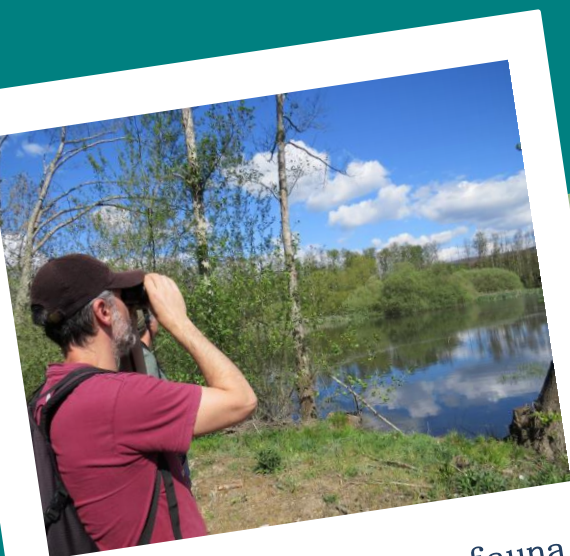
Observación flora e fauna